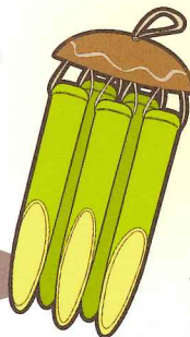
ウインドチャイム